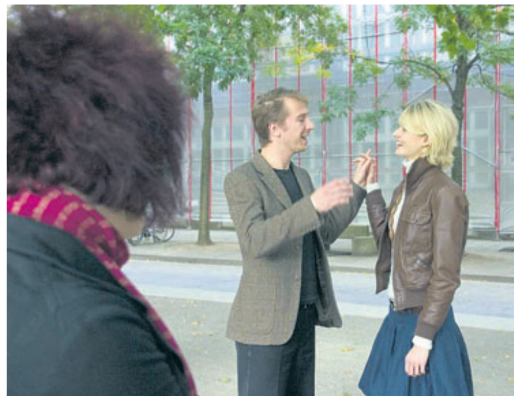
Tausend Mal berührt – und erst als der beste Kumpel eine Freundin hat, bemerkt sie, dass er doch mehr für sie ist. Eifersucht macht sich breit.