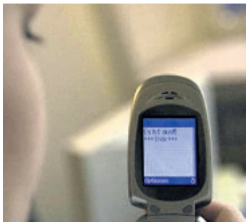
Voll fies: Schluss machen per SMS ist echt gemein!

Heute geht's um Schluss machen – und zwar um richtig fieses Schluss machen. Die wohl beliebteste Methode dafür ist die SMS. Wem die einfachen drei Worte („Es ist aus / Schluss / vorbei!“) zu viel sind, der kann die Abkürzung LEIS benutzen. Das steht für „Liebling, es ist Schluss.“ Mehr fiese Tricks gibt's im Internet. Zum Beispiel diesen flotten Reim: „Für dich war ich 'ne dumme Kuh, doch der Idiot, der bist jetzt DU! Du kriegst nie mehr einen Kuss, denn jetzt mach ich mit dir Schluss!“ Auf der Seite www.schlussmachen.com findet man die sogenannte „Schluss-mach-Agentur“. Die bietet ganze Pakete an. Man kann wählen zwischen „lieb“, „böse“ oder „einfach“ Schluss machen. Für alle die etwas öfter Schluss machen müssen, gibt es für nur 34,95 Euro das „Schluss-mach-Abo“. Die Agentur bietet aber mit ihrem „Dr. Winter-Team“ auch positive Lebenshilfe an. Denn Dr. Winter hilft